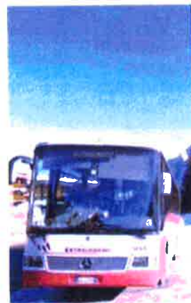
Il servizio parte sabato prossimo

bus: Linea 1 Malé - Monclassico - Dimaro - Daolasa Hub; Linea 2 Malé - Dimaro - Daolasa Hub; Linea 3 Daolasa Hub - Dimaro - Madonna di Campiglio; Linea 4 Daolasa Hub - Osana - Cogolo - Peio Fonti e infine Linea 5 Daolasa Hub - Osana - Vermiglio - Passo Tonale. Ricordiamo infine che il ser-