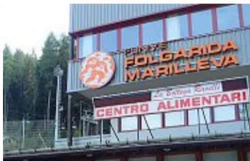
Dimaro Il quartier generale di Funivie Folgarida Marilleva