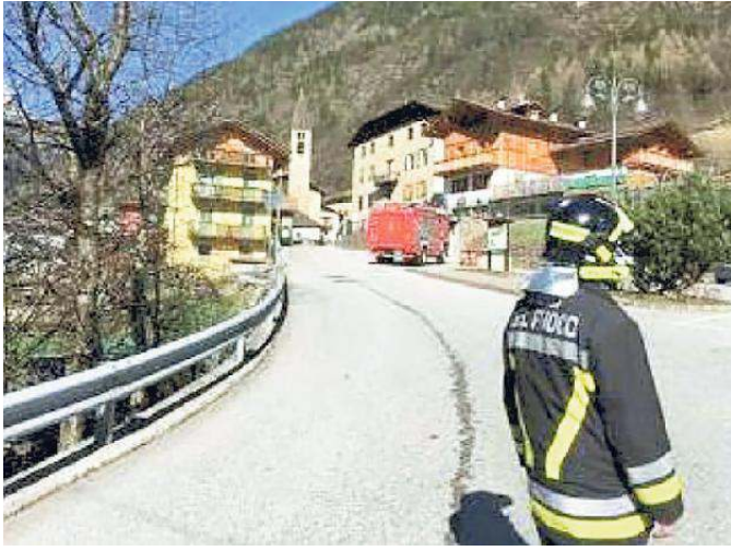
L'intervento dei vigili del fuoco per l'incidente ieri a Magras

te allertati dalle dipendenti del bar e del negozio alimentare situati a pochi metri dalla zona dell'incidente, sono sopraggiunti presto sul luogo. Vigili del fuoco, operatori del 118 e dell'elisoccorso hanno provato a fare di tutto per riannimare il pensionato, ma per lo sfortunato 76enne non c'è stato nulla da fare.