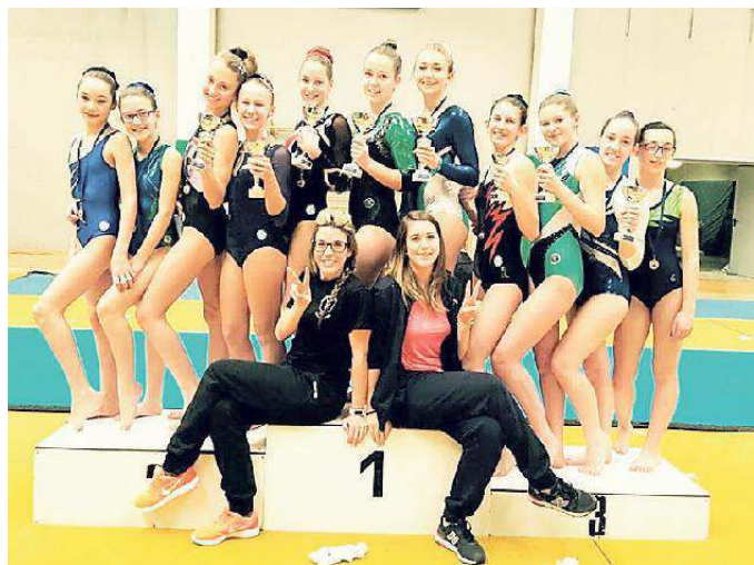
Le atlete della Ginnastica Acrobatica Valli del Noce con i trofei

L'Acrobatica Valli del Noce inizia la stagione alla grande e attende direttive sul palazzetto di Mezzana